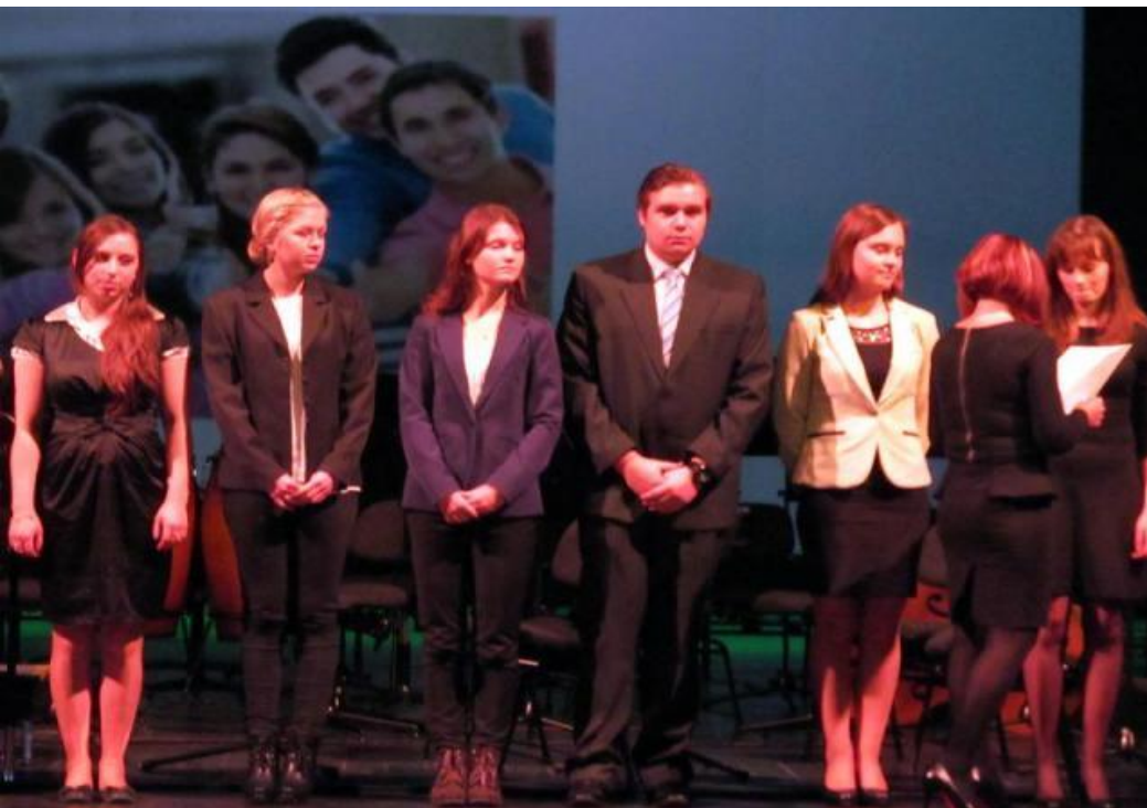
Stypendyści woj. podlaskiego